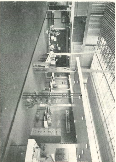
De onder Van der Heem-naam te verkopen producten zijn voor het eerst in een aparte Van der Heem-stand tenoon-gesteld.